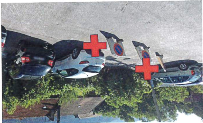
Parking du Château

Aucune circulation des véhicules de chantier ne sera autorisée en dehors de la zone d'occupation.